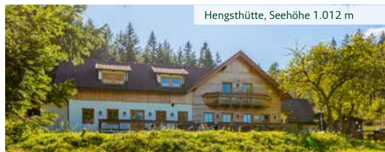
Hengsthütte, Seehöhe 1.012 m

FISCHERHÜTTE • Auf 2.049 m höchste Schutzhütte Niederösterreichs mit gutbürgerlicher Bergsteigerkost. 3 Zimmer, 36 Lagerplätze und traumhafte Fernsicht. +43 2636 23 13 | fischerhuette@schneeberg.tv